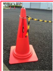
チェーン付カラーコーンを先頭か最後尾に設置