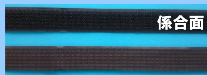
片面係合バックルグリップ