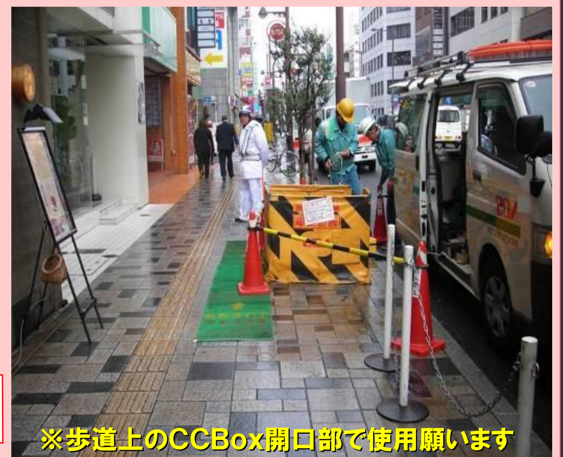
※歩道上のCCBox開口部で使用願います