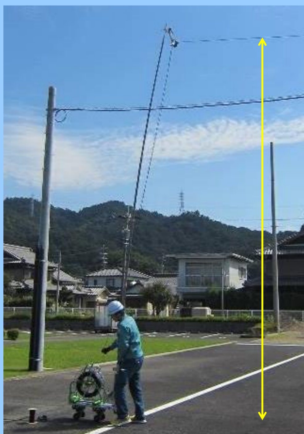
①地上高5mを確保しつつ道路横断