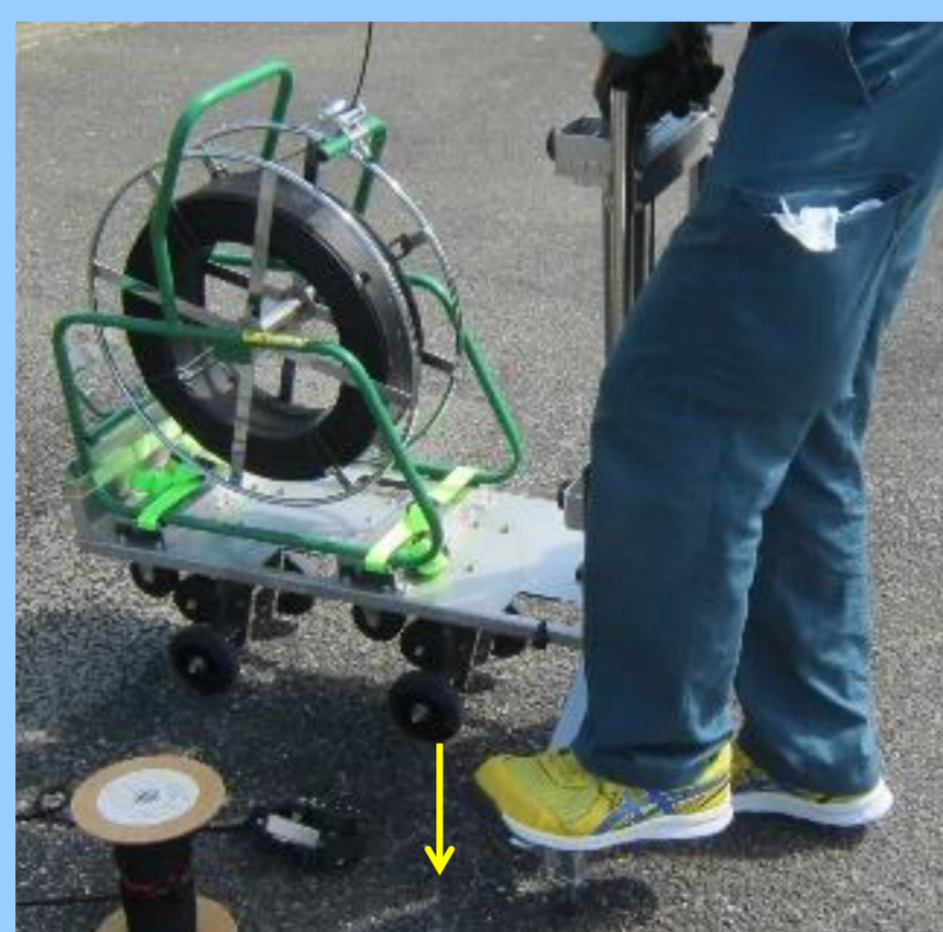
②アウトリガー張り出し・静止