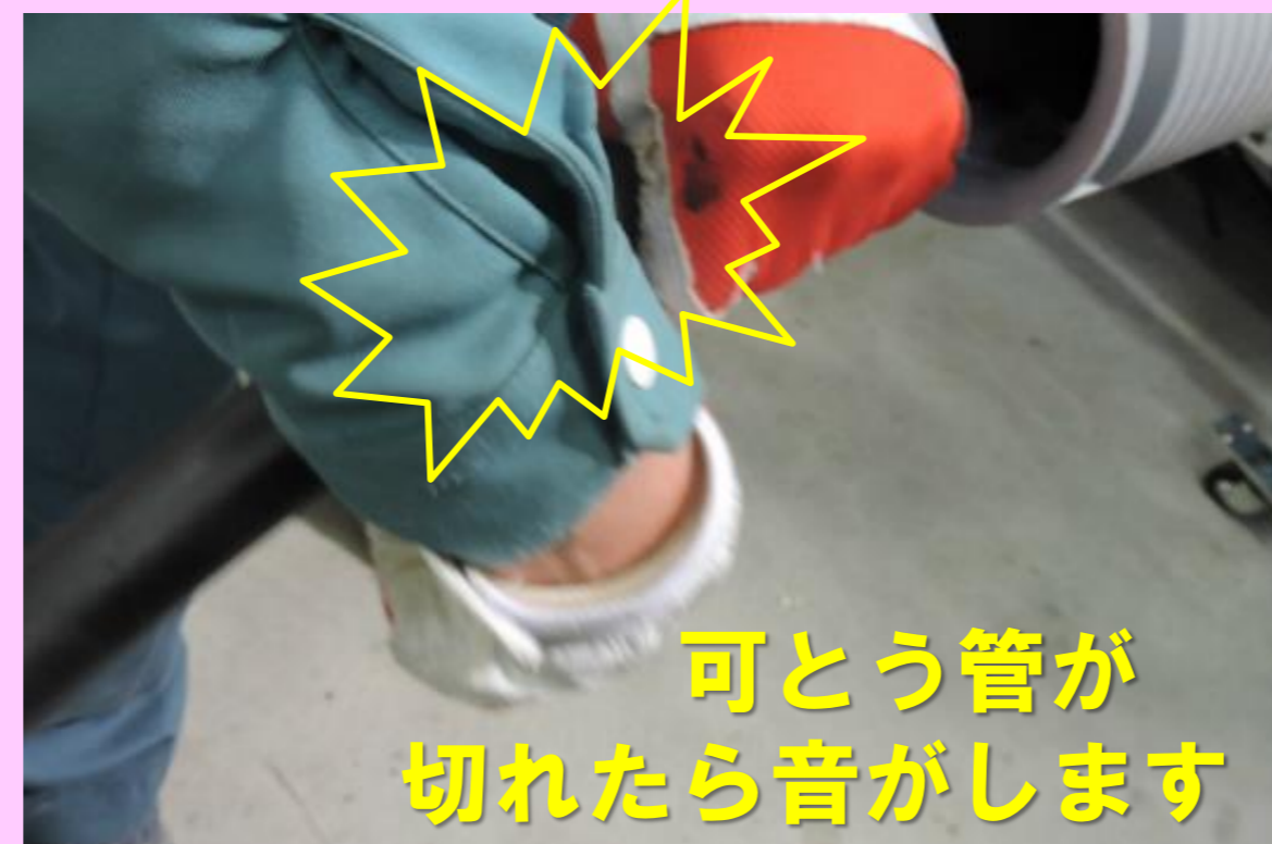
④更にネジを締め付けて もう一周刃を入れます。