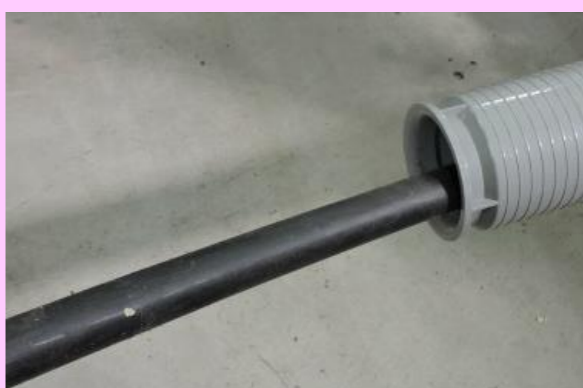
ケーブル保護用可とう管