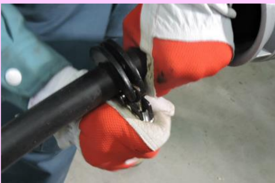
③円周方向に工具を回し 一周刃を入れます。