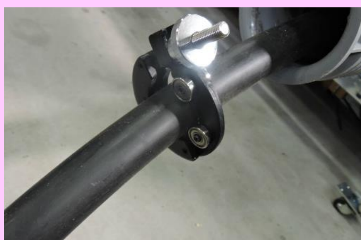
①切断したい位置に 工具を取付けます。