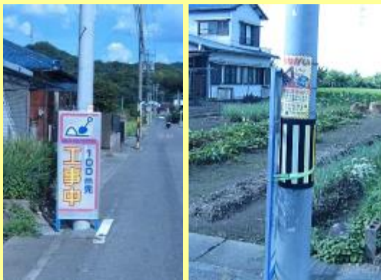
電柱へ設置する場合