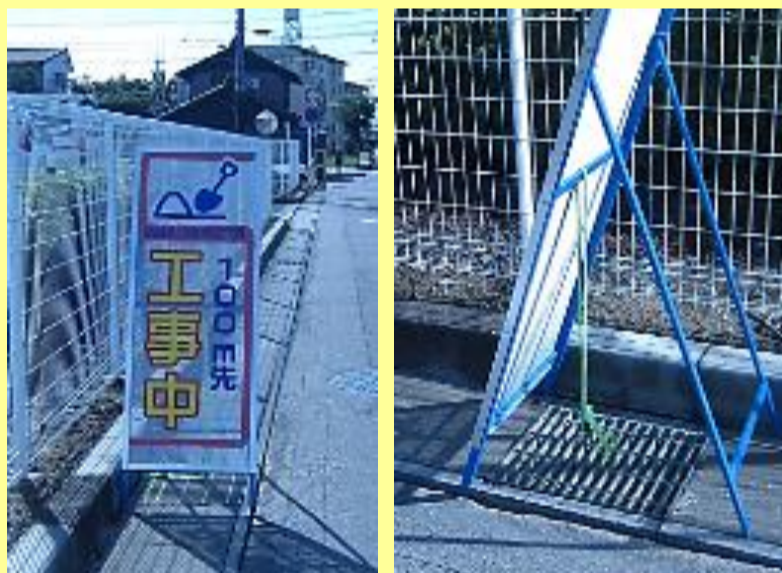
グレーチング・側溝へ設置する場合