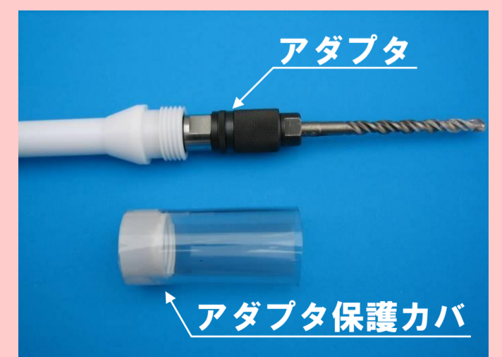
ドリル刃交換時はアダプタ保護カバを取り外します