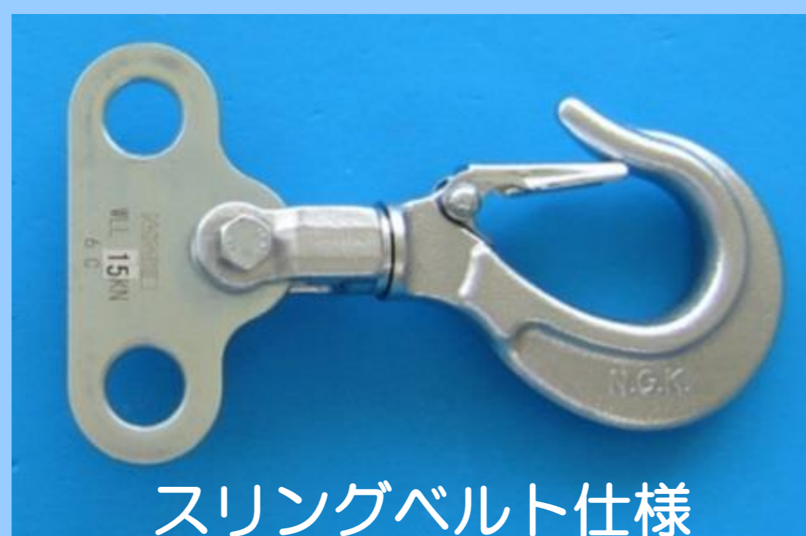
スリングベルト仕様