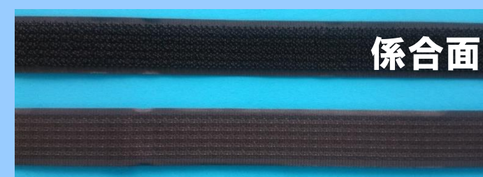
片面係合バックルグリップ