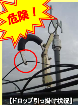
【ドロップ引っ掛け状況】